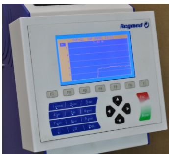
Painel de controle